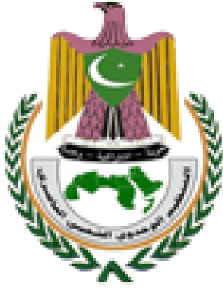
مكون التنظيم الوحدوي الشعبي الناصري في مؤتمر الحوار وكل المستويات القيادية

التي ساندت هذا الدور والذي جسد انحياز التنظيم الكامل والمطلق لتاريخه ونضاله وبرنامجه الخاص بالثورة وبناء الدولة وتحقيق مجتمع العدل والمساواة التي ينعم به اليمينيون جميعاً بفرض العيش الكريم. ووقفت الأمانة العامة أمام التحديات التي تواجه مخرجات الحوار وتنفيذها على أرض الواقع ودعت إلى بناء تيار وطني مدني يحمل هذا المشروع ويقطع الطريق على دعاة مشاريع العنف والخراب من خلال تعزيز التحالفات السياسية وتفعيل دور اللقاء المشترك وإنشاء المنظمات المدنية والأهلية وإحداث تغيير جذري وحقيقي في الأداء الحكومي والإدارة العامة للدولة والبدء الفوري بعملية إصلاحات حقيقية وفق مخرجات الحوار وتهيئة المناخات للاستفتاء على الدستور الجديد.