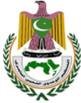
مكون التنظيم الوحدوي الشعبي الناصري في مؤتمر الحوار وكل المستويات القيادية

التي ساندت هذا الدور والذي جسد انحياز التنظيم الكامل والمطلق لتاريخه ونضاله وبرنامجه الخاص بالثورة وبناء الدولة وتحقيق مجتمع العدل والمساواة التي ينعم به اليمينيون جميعاً بفرض العيش الكريم. ووقفت الأمانة العامة أمام التحديات التي تواجه مخرجات الحوار وتنفيذها على أرض الواقع ودعت إلى بناء تيار وطني مدني يحمل هذا المشروع ويقطع الطريق على دعاة مشاريع العنف والخراب من خلال تعزيز التحالفات السياسية وتفعيل دور اللقاء المشترك وإنشاء المنظمات المدنية والأهلية وإحداث تغيير جذري وحقيقي في الأداء الحكومي والإدارة العامة للدولة والبدء الفوري بعملية إصلاحات حقيقية وفق مخرجات الحوار وتهيئة المناخات للاستفتاء على الدستور الجديد.